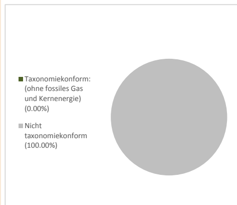
1. Taxonomiekonformität der Investitionen einschließlich Staatsanleihen*