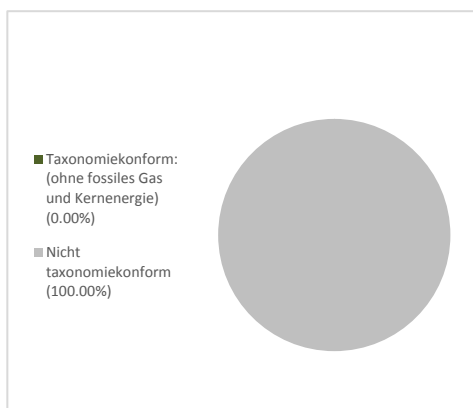
2. Taxonomiekonformität der Investitionen ohne Staatsanleihen*