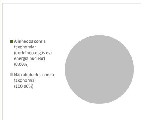
1. Investimentos alinhados com a taxonomia, incluindo as obrigações soberanas*