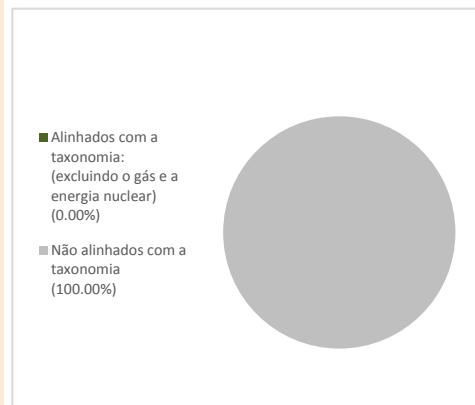
1. Investimentos alinhados com a taxonomia, incluindo as obrigações soberanas*