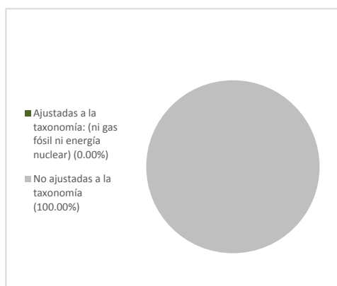
2. Ajuste a la taxonomía de las inversiones, excluidos los bonos soberanos*